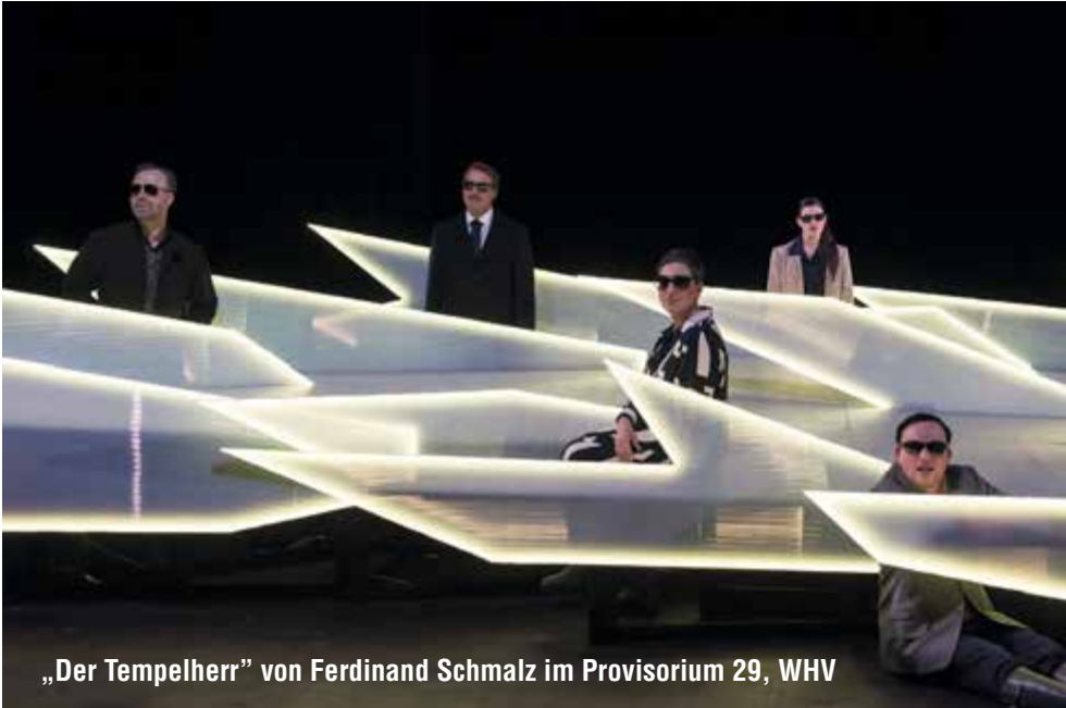
„Der Tempelherr“ von Ferdinand Schmalz im Provisorium 29, WHV