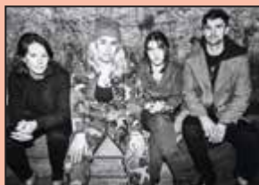
A Deer A Horse