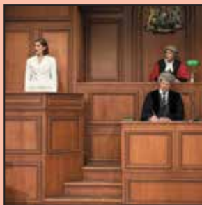
Zeugin der Anklage